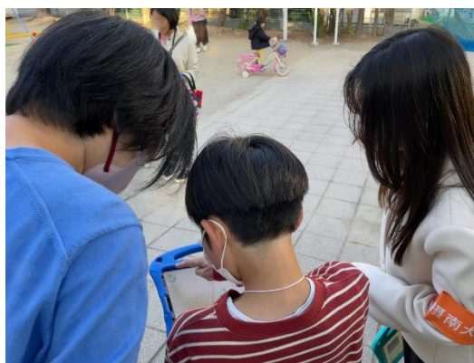
学生と参加者のまちあるきの様子

近年、地震や台風などの自然災害が頻発しており、防災意識の向上は喫緊の課題となっています。本イベントは、AR技術を活用することで、子どもたちがゲーム感覚で楽しみながら防災について学べる機会を提供します。加えて、地域住民が主体的に防災活動に参加することで、地域コミュニティの活性化にもつながることも期待しています。「AR防災まちあるき」は、小学生を含む家族を対象に、AR技術を活用した防災学習イベントです。「ドジでわがまま」な設定のドラゴンが、行く先々でハプニングを起こします。参加者はまちを歩きながらタブレット端末を使ってARクイズに挑戦し、ハプニングを解決することで災害時の危険箇所などを学んでいきます。