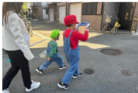
ARクイズを体験する子どもたち

同様のイベントは、今年9月に東大阪市石切東小学校校区においても開催しました。参加者からは、「楽しかった」という声が目立ったほか、「災害の時にどのような行動を取れば良いか分かった」「学校は、授業とかいっぱいあって訓練の時間は短いけど、町歩きでは、避難訓練を学ぶ時間があったて楽しかった」「本当に起こったら今日学んだことを思い出したいと思います」などの声が寄せられ、災害について考えるきっかけとなった様子が見受けられました。