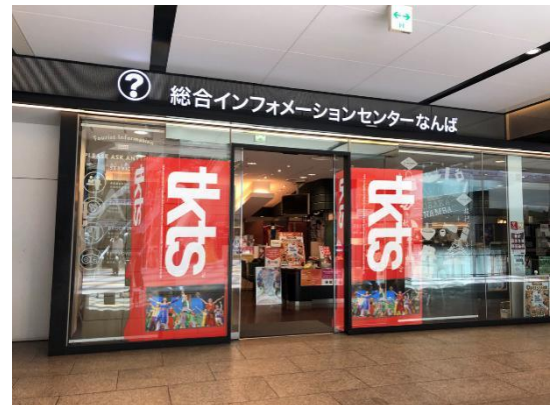
▲TKTS なんば@南海ターミナルビル内