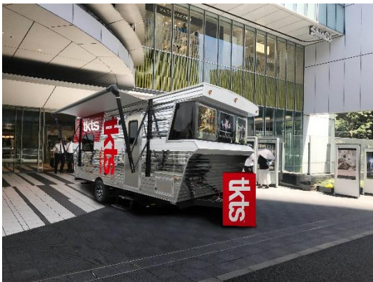
▲TKTS 渋谷@渋谷ヒカリエ

ロングランプランニング株式会社（東京都新宿区、以下:ロングランプランニング）は、NY ブロードウェイ発祥のディスカウントチケットストア「TKTS(ティーケーティーエス)」の旗艦店（以下:旗艦店）を、2019年8月29日（木）から「渋谷ヒカリエ」に、9月5日（木）から南海ターミナルビルの「総合インフォメーションセンターなんば」内に、それぞれ東京急行電鉄株式会社（東京都渋谷区、以下:東急電鉄）、南海電気鉄道株式会社（大阪府大阪市、以下:南海電鉄）の協力のもと、オープンいたします。