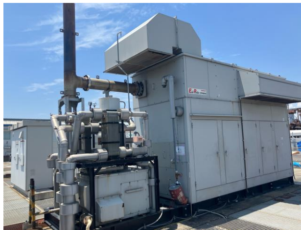
<400kW ガスエンジンコージェネレーションシステム「EP400G」>

大阪ガス株式会社(社長:藤原正隆、本社:大阪市中央区、以下「大阪ガス」)、大阪ガスの100%子会社のDaigas エナジー株式会社(社長:福谷博善、本社:大阪市中央区、以下「Daigas エナジー」)は、ヤンマーエネルギーシステム株式会社(社長:山下宏治、本社:兵庫県尼崎市、以下「ヤンマーES」)と共同で、ヤンマーES製の都市ガス仕様コージェネレーションシステム「EP400G」において、都市ガスに水素燃料を30%混焼する実証運転試験に成功しました。