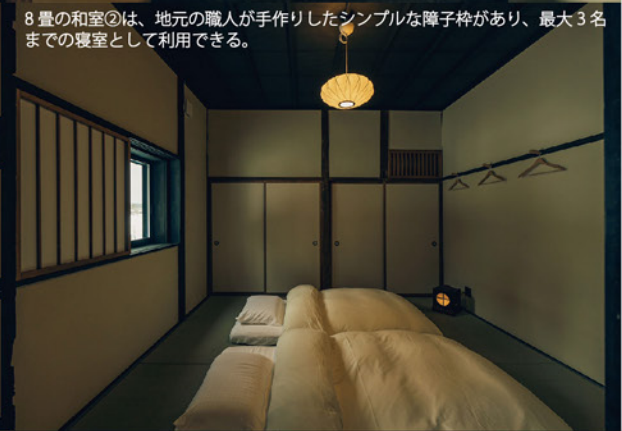
8畳の和室②は、地元の職人が手作りしたシンプルな障子枠があり、最大3名までの寝室として利用できる。