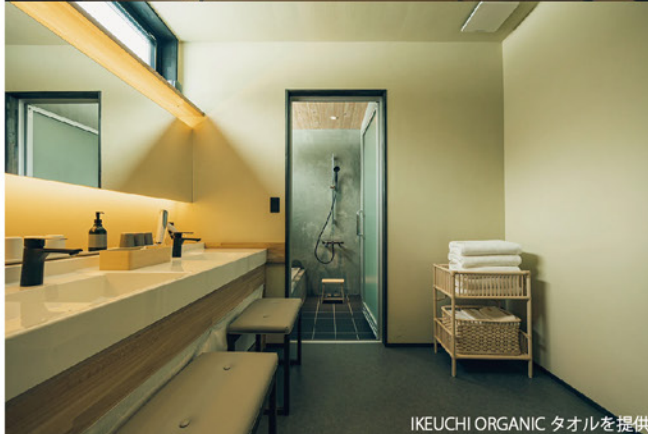
IKEUCHI ORGANIC タオルを提供。