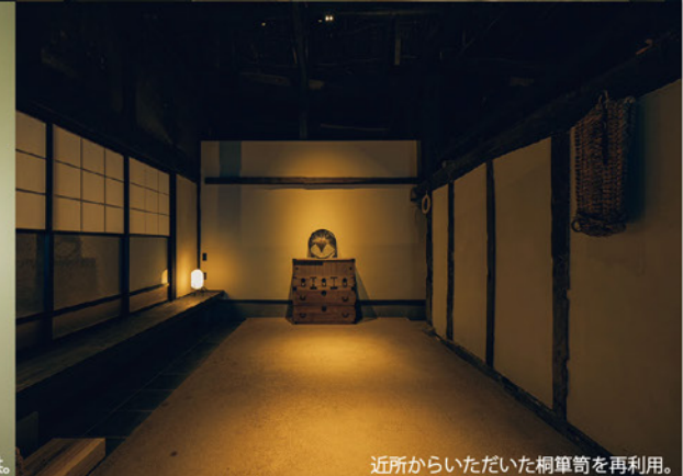
近所からいただいた桐箆筒を再利用。