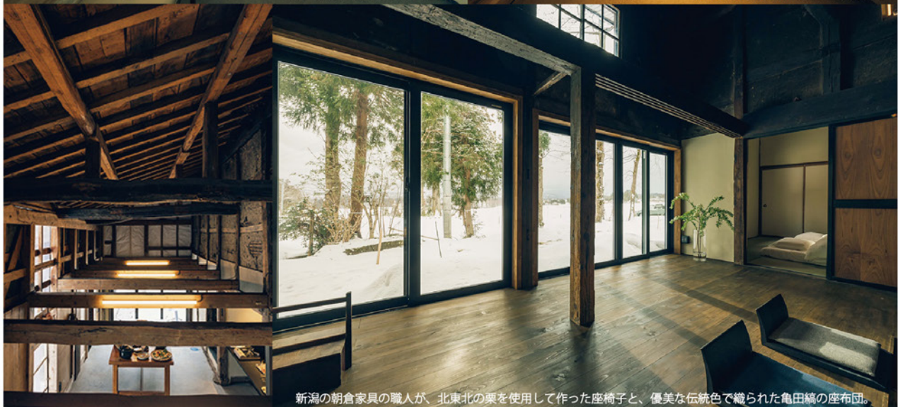
新潟の朝倉家具の職人が、北東北の栗を使用して作った座椅子と、優美な伝統色で織られた亀田織の座布団。