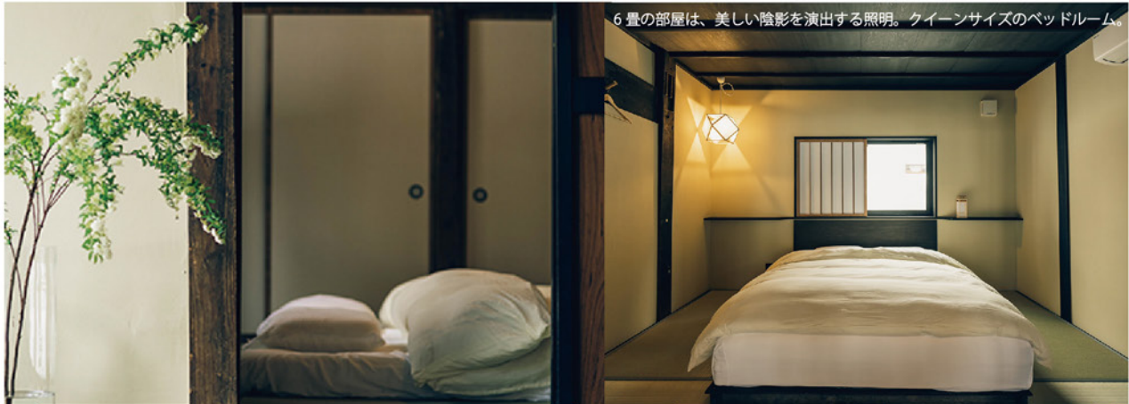
6畳の部屋は、美しい陰影を演出する照明。クイーンサイズのベッドルーム。