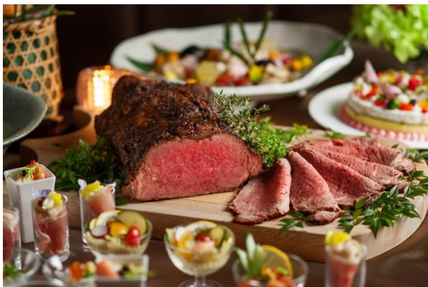
ほたるのタベディナーbuffeイメージ

宵闇に舞う蛍の光。蛍観賞の前にお楽しみいただく、華やかなお食事やトリートメントプランをご用意いたしました。海の高級食材「鮑」や好評の「ローストビーフ」を主役にした「ほたるのタベ ディナーbuffe」や、シェフが蛍の情景を表現したレストランメニュー、特別に閉園後の静けさを取り戻した庭園で蛍を愛でただける「Private Firefly Night Stay」、大人の夜を演出する「ほたるとスタンダードジャズを楽しむタベ」など、この季節限定のプランを各種ご用意いたしております。