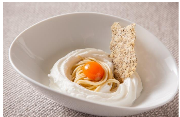
イル・テアトロ LE LUCCIOLE イメージ