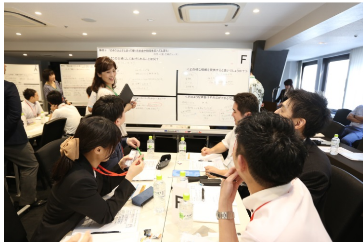
事例を基に、気付きやお客様への声掛けを話し合う様子