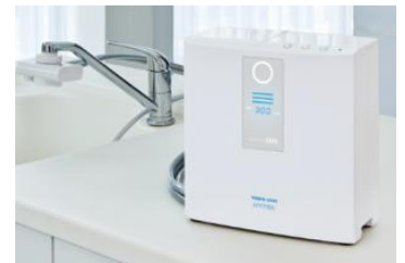
家庭用電解水素水整水器 トリムイオンHYPER

電解水素水整水器とは、水道水に含まれる塩素や鉛などの不純物を浄水フィルターに通して除去し、その水をさらに電気分解した、抗酸化性のある水素を豊富に含んだアルカリ性の水を生成する器械です。家庭用電解水素水整水器は胃腸症状の改善に効果・効能のある家庭用管理医療機器として認証されています。