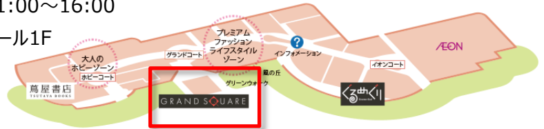
グランドモール1Fグランドスクエア

[注1]環境省では、平成26年8月1日（水の日）に、「水循環基本法」（同年7月施行）に基づき、健全な水循環の維持又は回復を目的とした取組の促進等を推進する官民連携プロジェクト「ウォータープロジェクト」を発足しました。（同年12月より本格始動）ウォータープロジェクトでは、水循環や水環境の保全に向けた民間企業による自発的・主体的取組を促進していくとともに、官民連携の機会を創出しています。平成27年6月30日現在、103の民間企業、地方公共団体、民間団体がプロジェクトに参加しています。