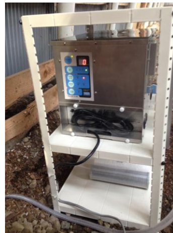
日本トリム製電解水素水生成器