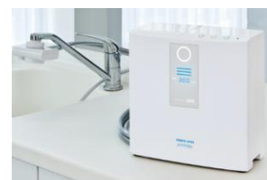
電解水素水整水器 トリムイオンHYPER

（※1）電解水素水整水器とは、水道水に含まれる塩素や鉛などの不純物を浄水フィルターに通して除去し、その水をさらに電気分解した、抗酸化性のある水素を豊富に含んだアルカリ性の水を生成する器械です （※2）トリムイオンHYPERを使用し、1日21リットルを5年使用した時の500mlあたりの単価（カートリッジ・電気代・水道代含む）