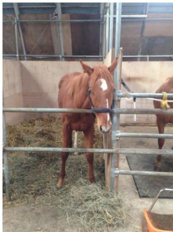
研究に使用した競走馬

先日、日本ダービー2016が開催されましたが、競走馬の約90%が胃潰瘍を保有しています。当研究では、健康な馬の飲用水を水道水から電解水素水に変更し、一定期間を経た後、実験的に胃潰瘍を発生する薬を投与したところ、水道水に比べ胃潰瘍発症の有意な抑制が見られました。現在、国内の馬の飼養頭数は7.4万頭と言われており、今後、畜産分野にも電解水素水生成器の拡がり期待されます。