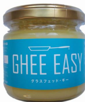
「GHEE EASY」 100g ¥1,280 (税抜)

株式会社フラット・クラフト(本社：東京都千代田区、代表取締役：吉川克弥)は、オランダ産グラスフェッド・ギー「GHEE EASY（ギー・イージー）」を、5月上旬より販売開始いたします。