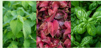
青紫蘇 赤紫蘇 バジル