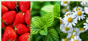
イチゴ ミント カモミール