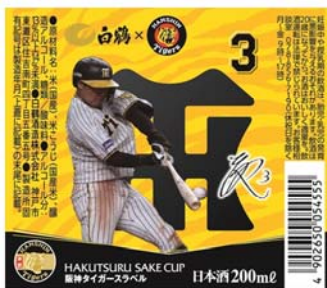
<ラベル表面 イメージ>