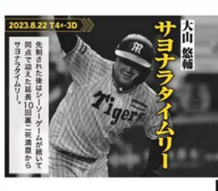
<ラベル裏面 イメージ>