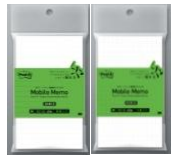
詰め替え用 (メモ帳サイズ) 罫線、方眼