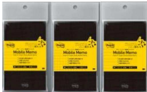
メモ帳サイズ 罫線、方眼、無地アソート /