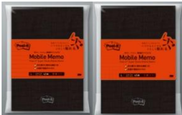
ノートサイズ 罫線、方眼 /