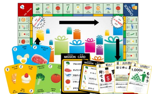
▲テーブルゲーム例