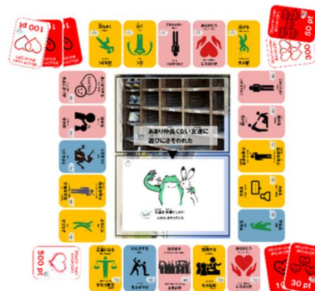
▲テーブルゲーム例