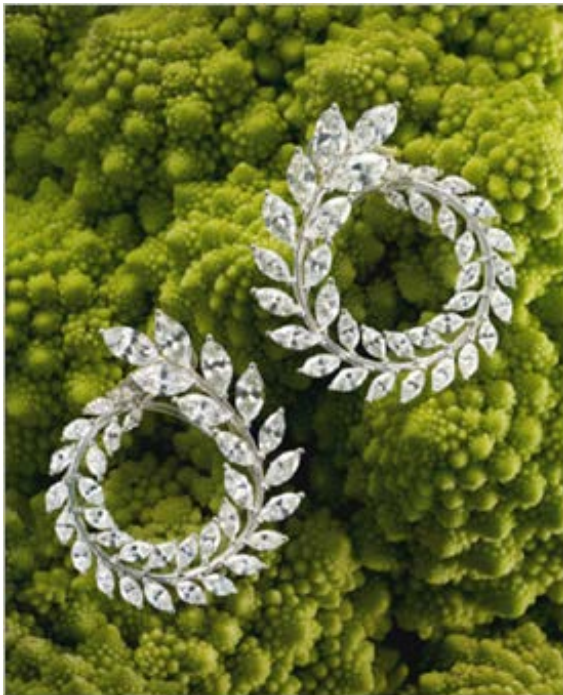
左：グリーンカーペットコレクションピアス 2014年1月ゴールデングローブ賞授賞式にて、主演女優賞受賞 ケイト・ブランシェット着用 18KWG×ダイヤモンド¥11,320,000- (税別)

また期間中、伊勢丹新宿店本館1階＝ザ・ステージ限定にて、「グリーンカーペットコレクションアイスキューブリング」が販売されるほか、人気のハッピーハートジュエリーの先行販売など、さまざまな特典をご用意しております。ぜひ、この機会に足をお運びください。