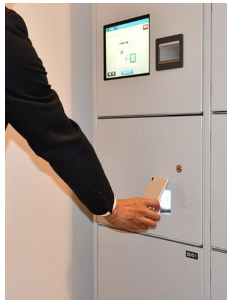
読み取り端末にQRコードをかざして荷物を受領