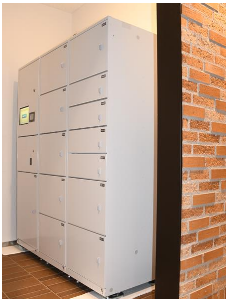
『赤坂インターシティAIR』に設置された宅配ロッカー

日鉄興和不動産では、本格運用後も継続して利用者評価を行い、「宅配ロッカーサービス」の向上を図ると共に、同社が管理、運営する他のオフィスビルへのサービス展開を検討してまいります。