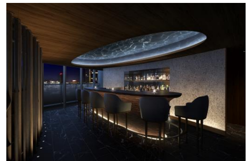
▲「スカイラウンジ」完成予想 CG

さらには、街との調和を目指し、豊かな緑と共に水や風・人の流れをデザイン。周辺地域への豊かな自然環境の提供を目指し、生物多様性保全に配慮した ABINC 認証（※2）、緑の保全・創出への取り組みを評価する SEGES 認定（※3）をとともに取得。加えて、快適性と省エネを両立する ZEH-M Oriented 基準を満たし、地球環境に配慮する認定低炭素住宅の認証を取得するなど、未来を見据えた住まいの環境性能を整えます。