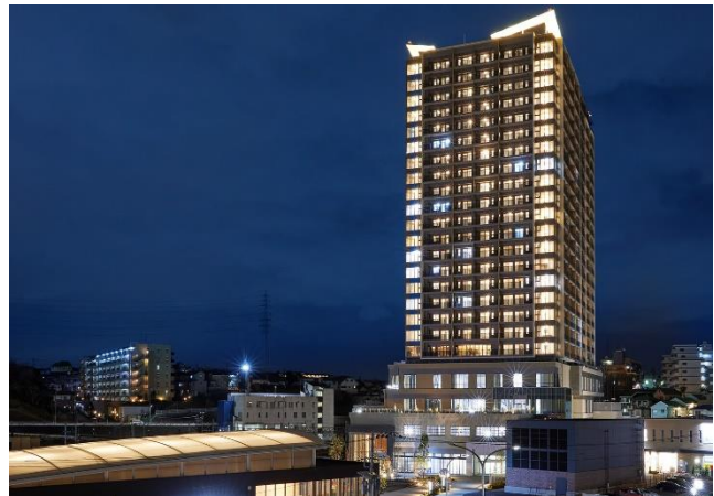
▲『リビオタワー羽沢横浜国大』（2023年11月竣工）