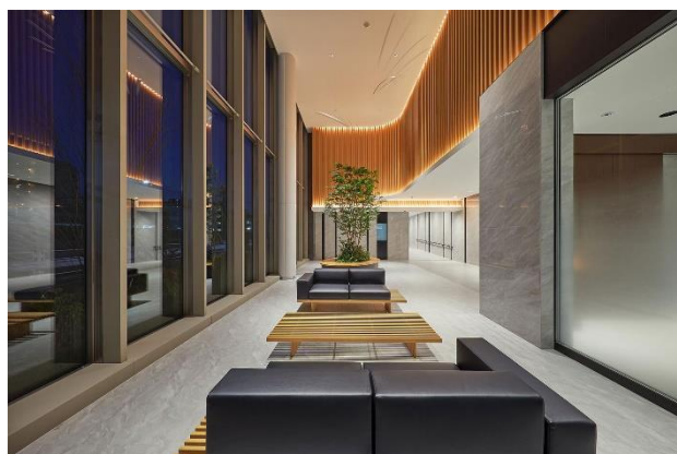
▲メインエントランス