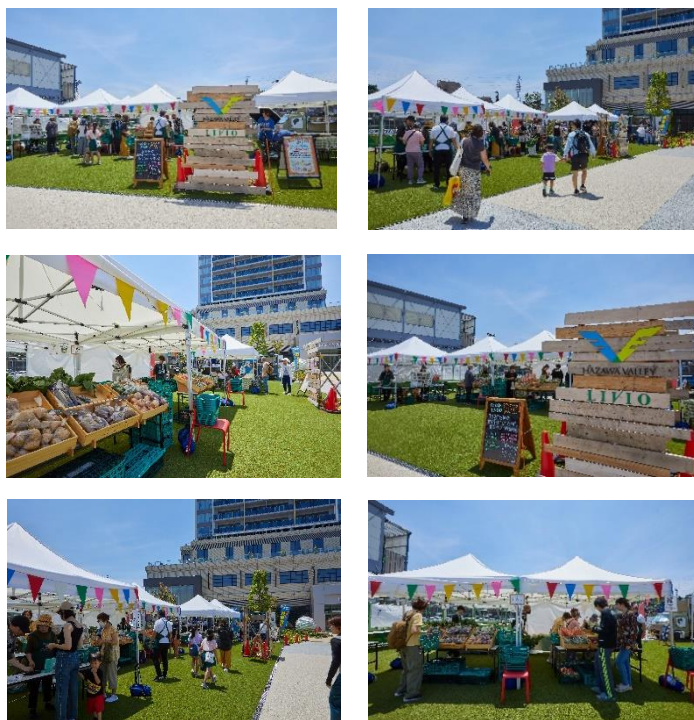
▲『HAZAWA VALLEY MARCHE』開催の様子