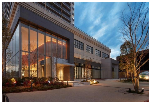
▲エントランス外観