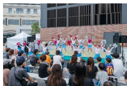
▲ 『HAZAWA VALLEY FES 2024』 当日の様子