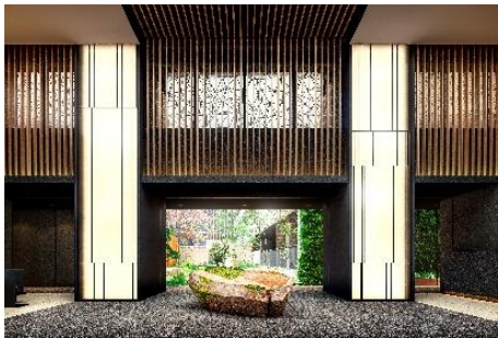
▲エントランスホール