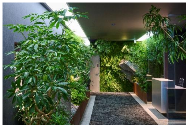
▲グリーンコリドー