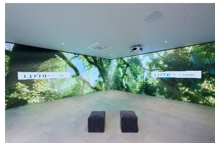
▲イマーシブシアター