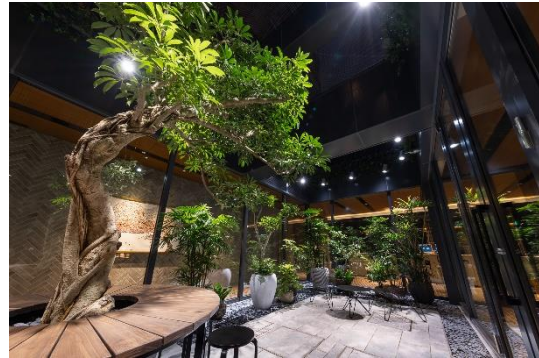
▲緑に囲まれたテラス