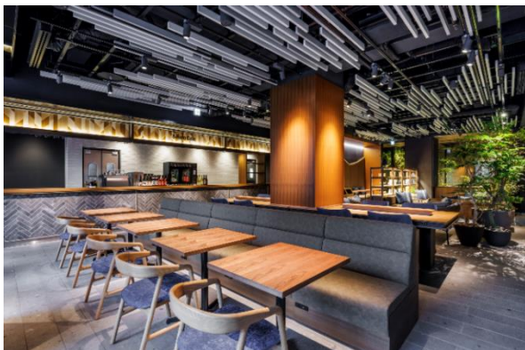
▲エントランスラウンジ

※1：2024年3月、東京・上野に開業したレジデンシャルホテル「&Here（アンドヒア）」の第1号ホテル https://www.nskre.co.jp/company/news/2024/03/docs/20240313.pdf