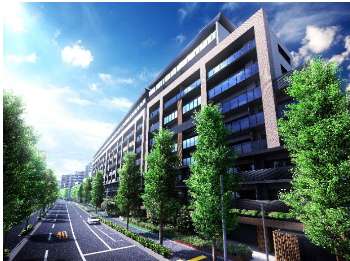
『リビオシティ文京小石川』完成予想イメージ