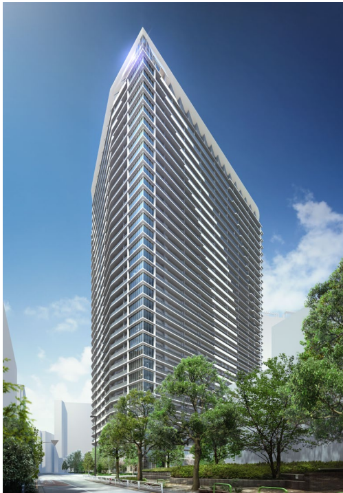
『リビオタワー品川』完成予想イメージ

「リビオ」は今後も各エリアが持つ文化や特性を最大化させ、“変化し続ける東京の生活に柔軟に対応し、一歩先の未来に寄り添い続け、人生を豊かにするブランド”として活動し続けてまいります。