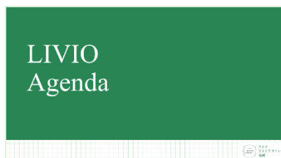
『LIVIO Agenda -暮らしの未来-』表紙