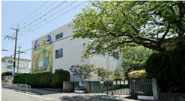
豊中市立少路小学校

『リビオ豊中少路』は「豊中市立少路小学校」「豊中市立第十一中学校」徒歩 10 分圏内の指定校区に 17 年ぶりの新築分譲マンション※ 1 として誕生します。周辺には「大阪大学」「大阪音楽大学」が存在し、文教エリアとして知られる豊中市は「こども医療助成」「とよなか子育て応援団」「公立こども園の整備計画」など子育て支援制度も充実しています。