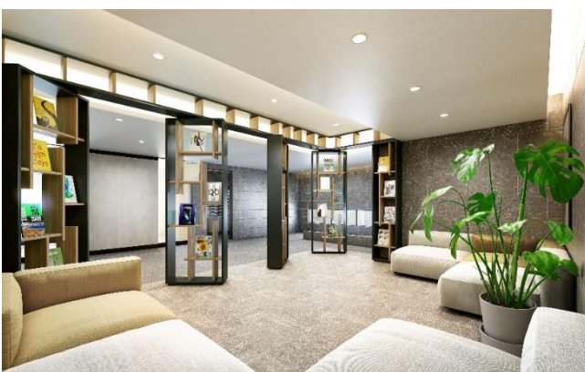
共用エントランス ブックサロン完成イメージ

憧れを集める文教エリアに相応しく、エントランスにはブックサロン、敷地内にはヒーリングガーデンを設置し、美しく心豊かな暮らしを実現できる計画としました。ブックサロンでは Wi-Fi 環境を設置、マンションに居ながらサードプレイスとなる空間を配し、新しいマンションライフの価値を提供いたします。敷地内ヒーリングガーデンでは、暖かな陽光を享受できる憩いの場としてご利用いただけます。