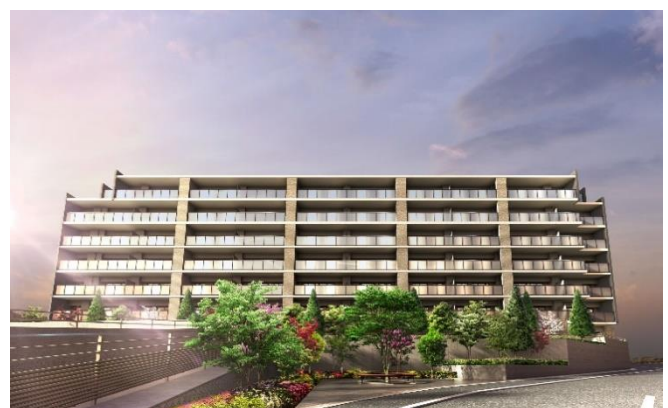
ヒーリングガーデン完成イメージ