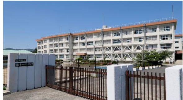
豊中市立第十一中学校