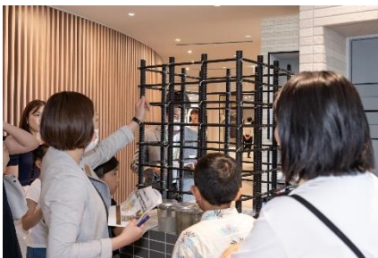
自由研究イベント

当社は「人生を豊かにデザインするためのマンション」のブランドコンセプトの通り、入居者様・契約者様を対象として人生を豊かにするためのヒントやきっかけとなるサービスとして、2023年7月より様々なイベントを「LIVIO Life Design! SALON」にて開催しております。これまで、小学生を対象とした自由研究イベント、睡眠改善エクササイズ、夏のお掃除術セミナーなど幅広いテーマで開催してまいりました。今後もお客様の声を聞きながら、人生や暮らしを豊かにするコンテンツ、サービスを提供してまいります。