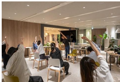
睡眠改善エクササイズ