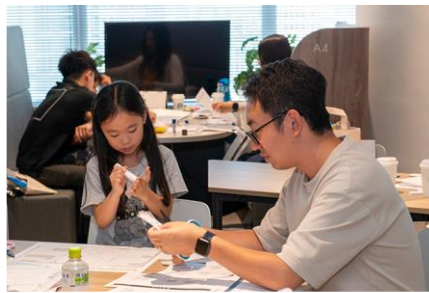
マンションキット工作※