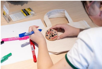
岩手県釜石市の間伐材を使った オリジナルバッジ作り