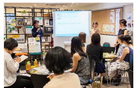
+ONE LIFE LAB ワークショップ