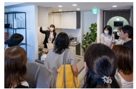
夏のお掃除術セミナー