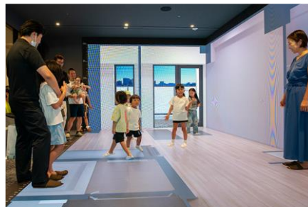
リアルサイズスクリーンのご紹介※