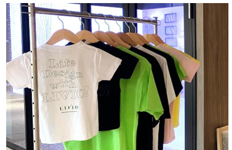
リビオオリジナルTシャツ プレゼント