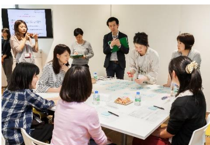
+ONE LIFE LAB ワークショップ