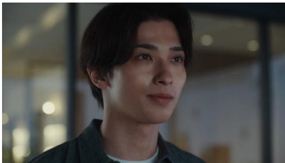
「見えるか、未来」篇 (30秒) より

なお、2023年9月8日より放映を開始した、横浜流星さんを主人公とした日鉄興和不動産新CMシリーズ第2弾「見えるか、未来」篇は本サロンが舞台となり撮影を行っております。