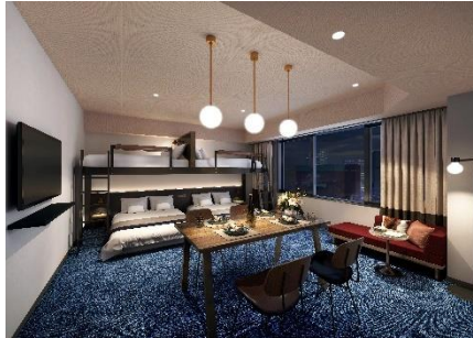
▲デラックスファミリー 匠 台東区の伝統工芸職人や工房をモチーフとした客室イメージ