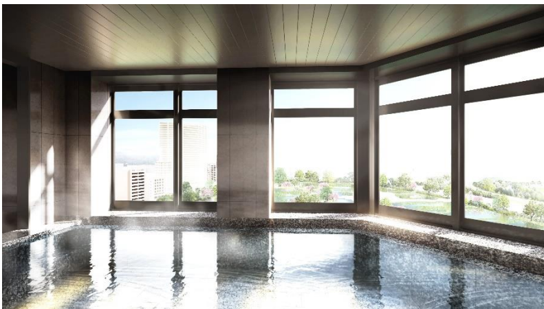
▲露天風呂付き大浴場完成予想図