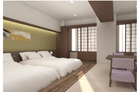
▲デラックスファミリー 文豪 多くの文人を輩出した地にちなみ、文豪をモチーフとした客室イメージ

客室の7割がファミリータイプとなっており、長期宿泊のための各種設備、ミニキッチン、冷蔵庫、電子レンジ、ダイニングテーブル、ベッド以外でくつろげる場所としてソファースペースや和室などくつろぎのための空間を提供。1階ロビー階には、ホテルラウンジとカフェスペースに加え、テレワークニーズを踏まえ、個室ブースのシェアオフィスを備える予定です。また、最上階（14階）には不忍池を望む露天風呂付き大浴場を備えています。