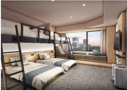
▲デラックスファミリー バンク バンクベッドのあるファミリータイプの客室

当ホテルの北側エリアは上野公園の自然に面する風光明媚なエリア（FOREST SITE）、南側エリアは江戸時代からの伝統工芸などを取り扱う老舗店などが軒を連ねるエリア（CULTURE SITE）と趣が異なり、それぞれのエリアイメージをコンセプトに客室をデザインし、客室を選ぶ楽しさを提供します。