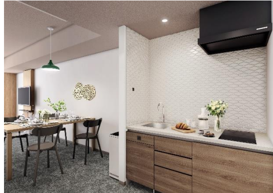
▲客室内ミニキッチン完成予想図