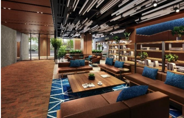
▲ホテルラウンジ完成予想図

客室の7割がファミリータイプとなっており、長期宿泊のための各種設備、ミニキッチン、冷蔵庫、電子レンジ、ダイニングテーブル、ベッド以外でくつろげる場所としてソファースペースや和室などくつろぎのための空間を提供。1階ロビー階には、ホテルラウンジとカフェスペースに加え、テレワークニーズを踏まえ、個室ブースのシェアオフィスを備える予定です。また、最上階（14階）には不忍池を望む露天風呂付き大浴場を備えています。