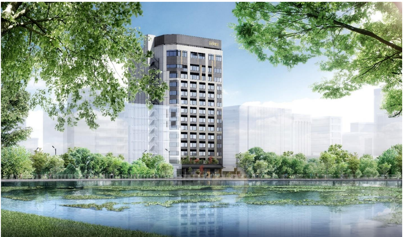
▲『&Here TOKYO UENO』外観完成予想図

開業に先立ち、2023年7月14日（金）より宿泊予約受付を開始いたしましたのでお知らせいたします。