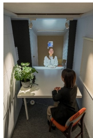
『会えルーム』内、対話の様子