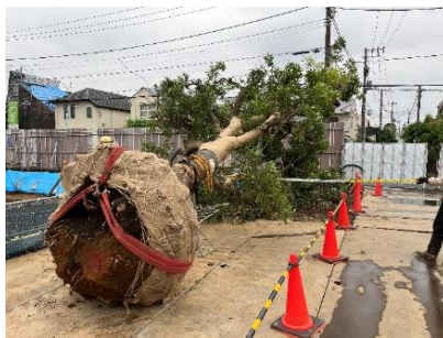
ヤマモモの移植工事の様子