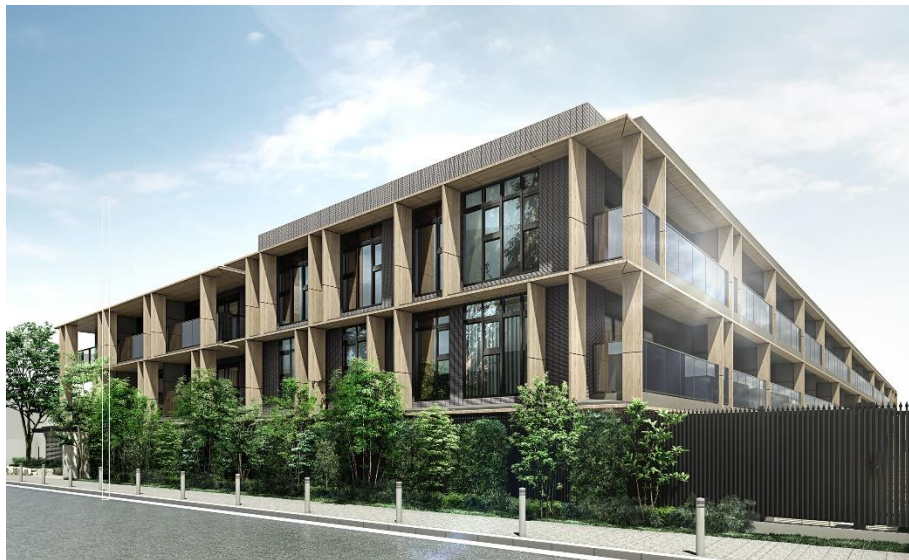
『グランリビオ浜田山』外観完成予想 CG

木目調のアルミパネルをメインに、コンクリートの重量感をなくし、自然の中で透けて水平に広がる和の感覚を取り入れることで、日本古来の建築美を感じさせながらも、繊細に研ぎ澄まされた、次世代の邸宅像を追求した外観意匠を計画しました。アルミパネルのマリオンにより統一された軽快なデザインが実現し、緑の上に浮かぶ、モダンでナチュラルな建築となっています。