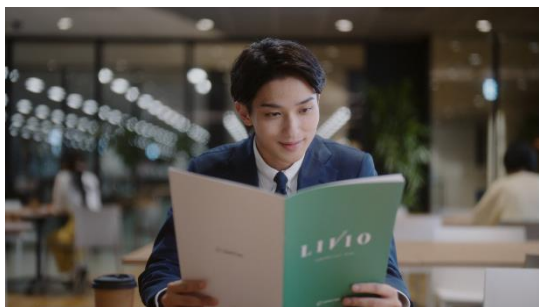
「人生が動き出す」篇 (60 秒) より

オフィスシーンと未来のプロポーズシーンは、赤坂インターシティ AIR の日鉄興和不動産オフィスで撮影されました。横浜流星さんと同僚女性の会話シーンの撮影が行われたオフィスフロアは、最先端オフィスのショールーム“Live Office”として、社外の皆さまにも広く公開しております。また、下に紹介するインタビューも赤坂インターシティ AIR にて撮影されました。