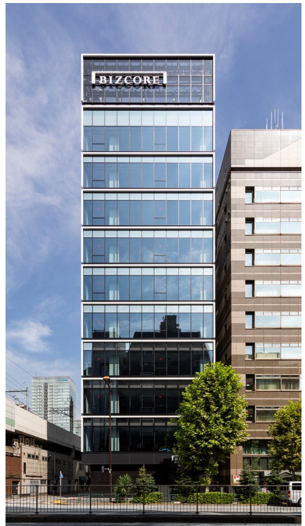
▲『BIZCORE 神田須田町』外観写真