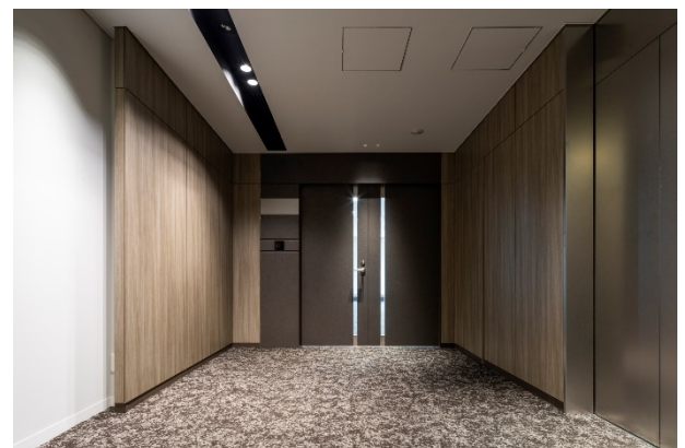
▲ 基準階エレベーターホール