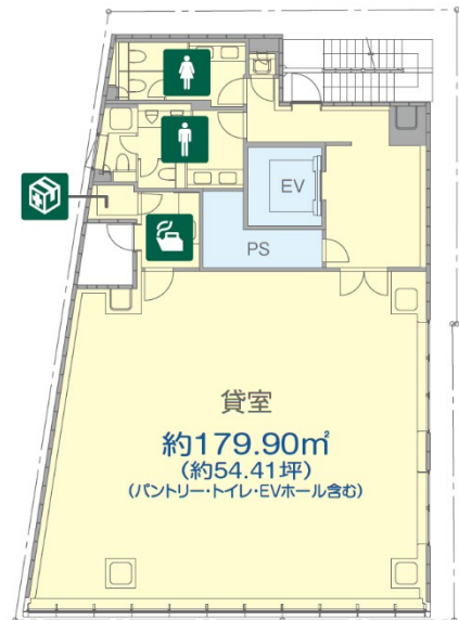
▲ 基準階フロアプラン