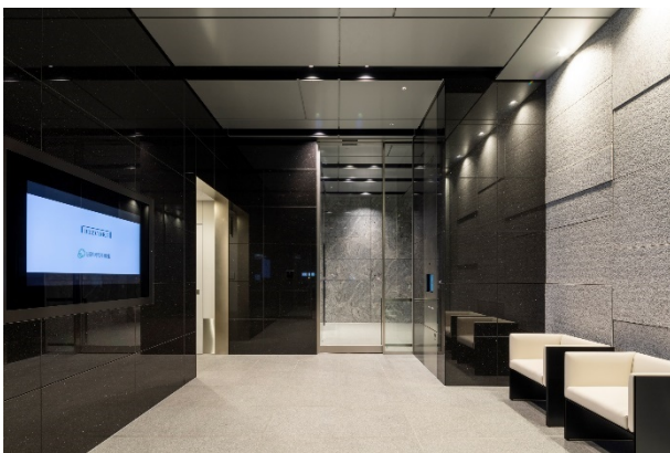
▲ 1 階エントランスホール

○ 基準階のエレベーターホールは、木目調を基調とした、温かみを感じさせる雰囲気演出。壁面は入居企業の館名サインを設置する等自由な設えとすることが可能であり、1 フロア＝「自分の城」であることを象徴します。