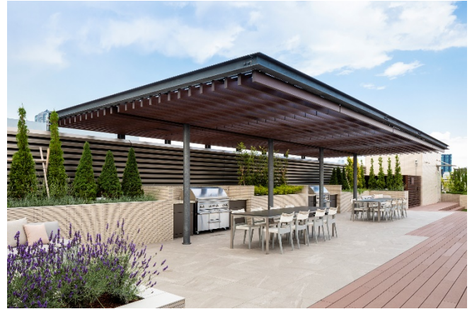
大型グリルを設置したバーベキューキッチン