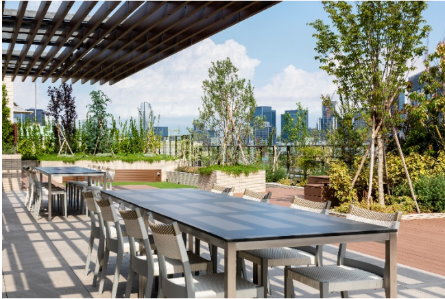
ルーフトップテラス