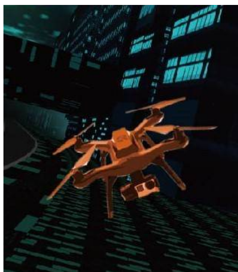
動的都市モデルとVR、プロジェクションマッピングの融合

今回表技協が披露するのは、動的都市モデル、3次元バーチャルリアリティソフトUC-win/RoadによるVR、プロジェクションマッピングの融合をテーマとした、最先端の表現技術開発への取り組みにおける最新の成果発表となります。