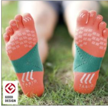
レーシングラン5本指