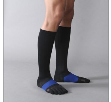
レーシングラン5本指ハイソックス