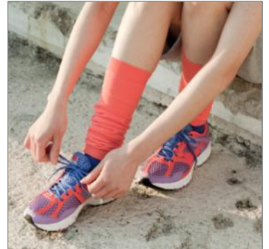
レッグウォーマー