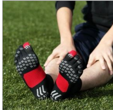
レーシングラン・エア 5本指