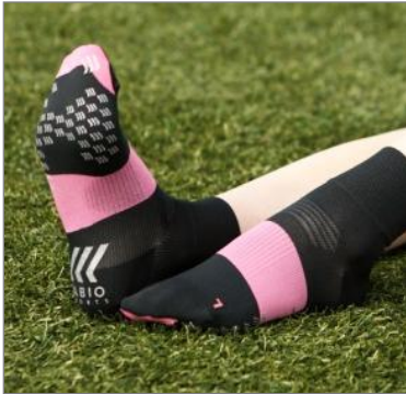
レーシングラン・エア 3Dソックス