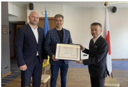
オデーサ市副市長への目録贈呈