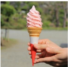
雁ヶ音茶屋 《期間限定》