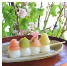
三溪園茶寮 《期間限定》