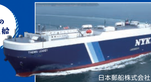
日本郵船株式会社