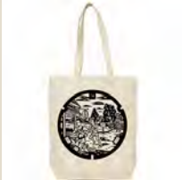
戸塚区駅伝マンホールバック