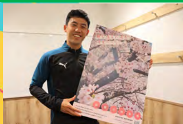
戸塚区出身プロサッカー選手 遠藤 航 選手

戸塚は自分が生まれ育った場所で、自分のサッカーの原点です。当時のチームメイトは今でも付き合いがあり、一生ものの仲間ですし、キャリアにおいて大事なパートナーである代理人とも出会った思い出がたくさん詰まった場所です。