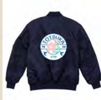
戸塚区オリジナルMA-1

上記の他にも、グルメや高級食器等、横浜ならではの お礼の品も 選びいただけます。詳細はプロジェクトページをご覧ください。