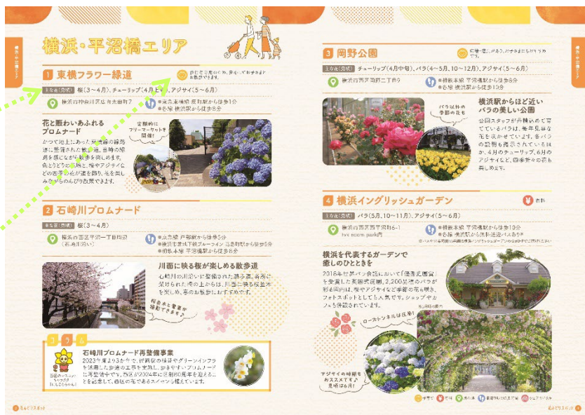
▲ エリアごとのスポット紹介ページ例

● お子さまとのお出かけにおすすめのスポットには、歩行者専用道路や遊具の情報などおすすめのポイントも掲載しています。