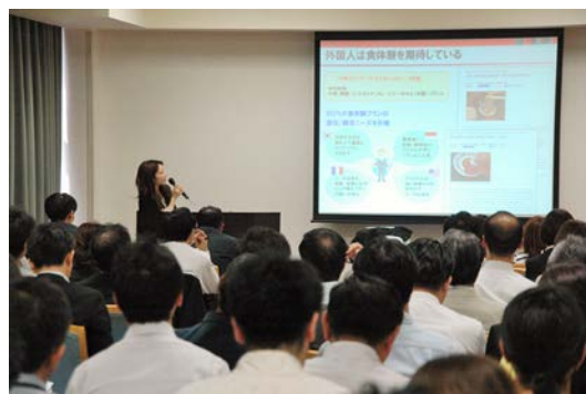
【イメージ：訪日外国人旅行者受入対応セミナー】