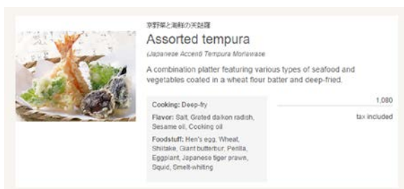
【イメージ：多言語メニュー】