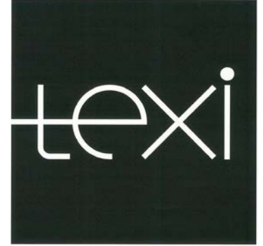
「texi」のロゴマーク ( t echnique × i dea)

今後、本格的な販路開拓支援のため、 世界最大級の雑貨等の国際見本市「アンビエンテ」に出展 します。また、市内外への PR を行っていくため、 YCC ヨコハマ創造都市センターにショールームを設置 します。