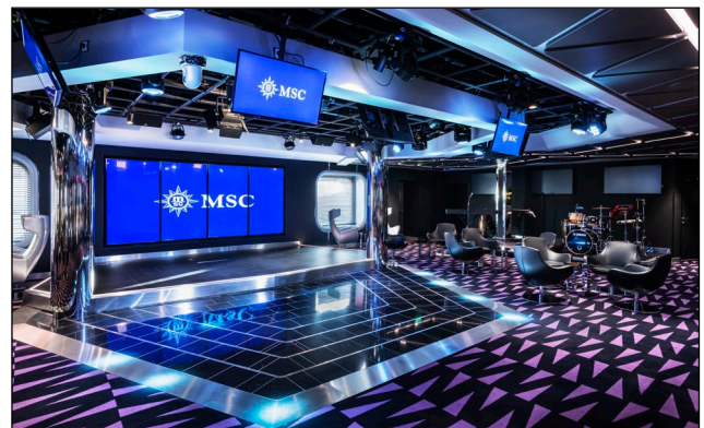
船内放送向けのTVスタジオ