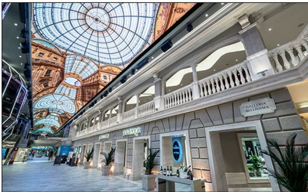
全長90mのプロムナードのドーム型LEDスクリーンの天井