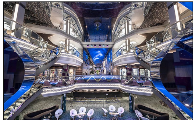
スワロフスキー社のクリスタルが敷かれた階段