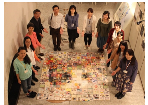
▲プレイベントの様子（250冊使用）

※このプロジェクトは、女子大学生が社会課題の解決に取り組むプロジェクトを企画しているNPO法人ハナラボ、公益財団法人横浜市芸術文化振興財団、横浜市の3者で連携し、取組を行っています。