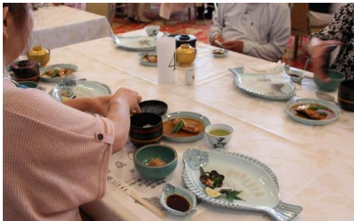
城下かれいミニ会席賞味会