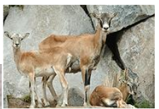
大人のムフロンシープ