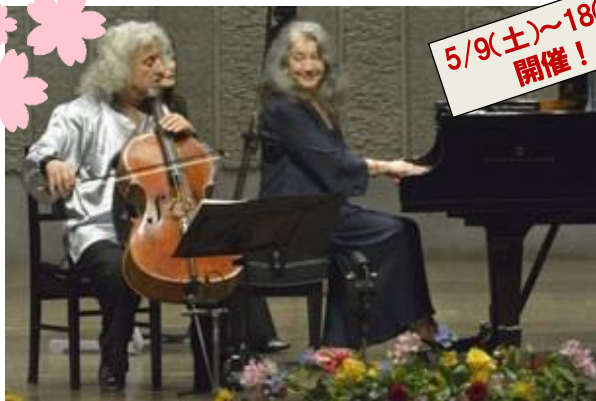
アルゲリッチとミシャ・マイスキー(過去の様子)

CHECK! JRおおいたシティの屋上広場では、常識破りの列車を生み出してきた工業デザイナー水戸岡鋭治がデザインしたミニトレイン「ぶんぶん号」に乗ることができます。また、大分県の中で最も社格が高いとされる神社「豊後一宮」である「柞原(ゆすはら)神社」の分霊、「鉄道神社」もあります！ぜひ乗車&参拝してはいかがでしょうか。