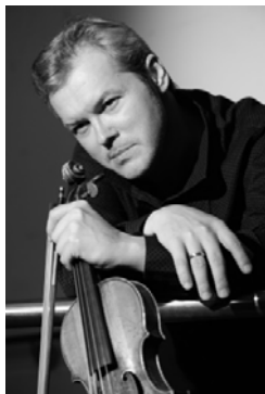
ワディム・レーピン