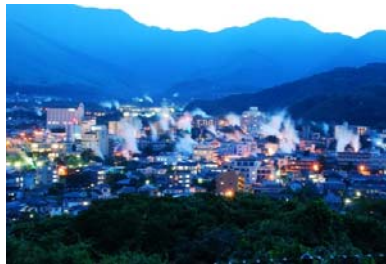
湯けむりライトアップ(湯けむり展望台)

4/1(金)~3(日)、第102回別府八湯温泉まつりを開催。温泉の恵みを感謝するまつりで市内約100カ所の公営温泉が無料開放されるほか、様々なイベントが開催されます。温泉まつり初日の夜は、市街地の背後に横たわる扇山を一気に焼く「扇山火まつり」が実施され、街をさらに盛り上げます。また、別府市鉄輪(かんなわ)地区では、毎週土・日、祝日の19:00~21:00に、湯けむりを色とりどりの光でライトアップしています。たなびく湯けむりは見る角度によって色が異なるため、幻想的な風景を楽しめます。おすすめは湯けむり展望台からの眺め。いたるところから立ち上る湯けむりを一望できます。