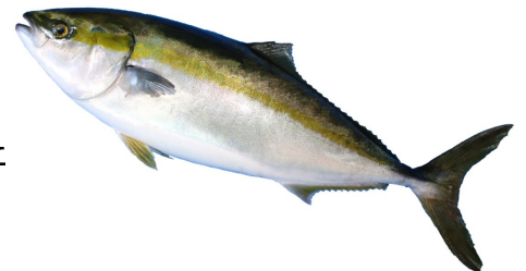
あたたハマチ to レモン

ご多忙のことと存じますが、ぜひ、貴メディアでのご取材やご紹介を賜りますようお願い申し上げます。