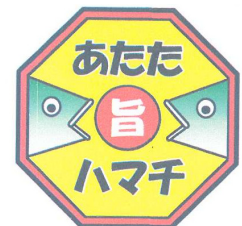
あたたハマチ to レモン ロゴマーク

餌にレモン果汁などを混ぜてハマチに与えることで、ほのかに柑橘の風味がしてさっぱりと食べられます。熱を加えると風味が増し、旨味が強くなります。