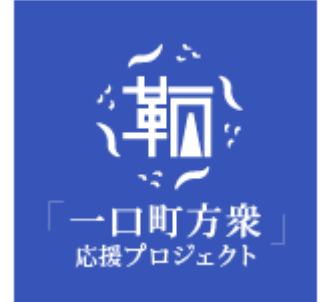
「鞆・一口町方衆」応援プロジェクト シンボルマーク