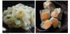
三重 / コリコリいかアオサ 抹茶ジュレ和え

三重県の地酒1杯と肴3品の味比べセット 1,300円 (税込) 伊勢慶酒 おかげさま+おつまみ3品「コリコリいかアオサ抹茶ジュレ和え」「伊勢たくあん」「ノマカツオの塩切り」 広島県の地酒1杯と肴3品の味比べセット 1,300円 (税込) 純米吟醸 幻 +おつまみ3品「がんす」「鳥皮みそ煮」「さざれ石」 また、宮城県産の地酒1杯と肴3品の味比べセットとして、 左記写真のセットメニューを、 1,300円 (税込)でご提供します。