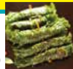
宮城 / しそ巻くるみ揚

宮城・三重・広島3県飲み比べセット 1,400円 (税込) 3県のメニューの中から、 地酒3杯+おつまみ3品が選べる、お得なセットです。