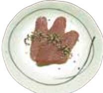
牛たんいぶり スモークスライス