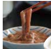
宮城 / 昔ながらの濃厚熟成塩辛

広島セット 900円 (税込) 純米吟醸 幻 +おつまみ2品「安藝紫」「子持ちこんにやく」