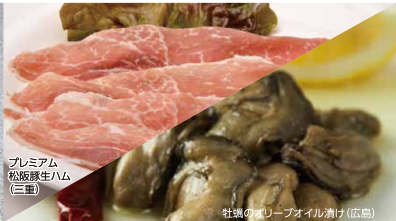
プレミアム 松阪豚生ハム (三重)