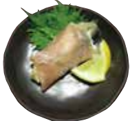
焼き牡蠣生ハム巻き