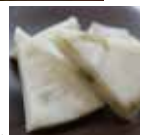
三重 / あおさはんぺん