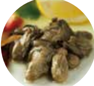
牡蠣のオイルブオイル漬け