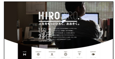
ひろしま移住サポートメディアHIROBIRO