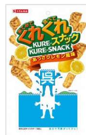
くれくれスナック