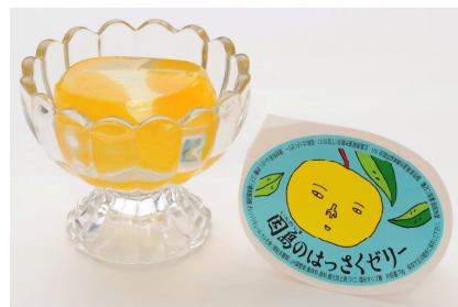
因島のはっさくゼリー

ご多忙のことと存じますが、ぜひ、 貴メディアでのご取材やご紹介を賜りますようお願い申し上げます。