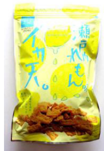
イカ天瀬戸内れもん味