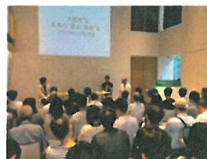
昨年度のオープンセミナーの様子 (27.8.30 @代官山 T-SITE)