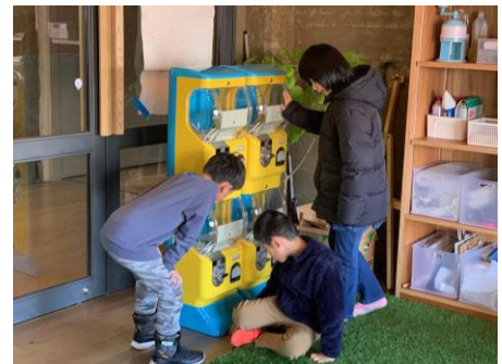
▲ESTEM山形校でガチャガチャを試す子どもたち