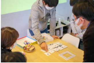
▲ 自作ボードゲームを発表

子どもたちが研究した内容を学会で発表する機会を作ったり、子どもたちがつくったボードゲームと一緒にクラウドファンディングに挑戦して製品化したりと、全国でも例を見ないユニークな学びの機会を提供しています。