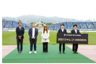
▲ 高校生との取組がJリーグから表彰