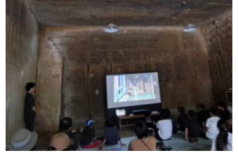
▲ 洞窟の中で自作映画上映会