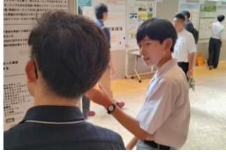
▲ 小中学生が学会で発表